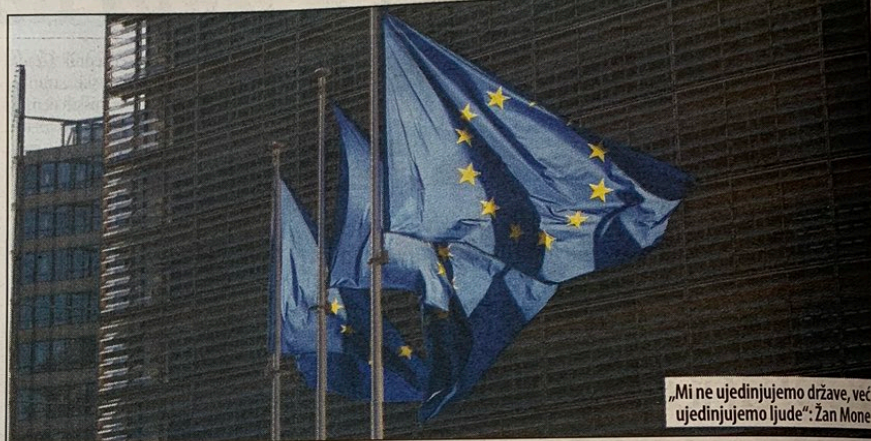
„Mi ne ujedinjujemo države, već ujedinjujemo ljude“. Žan Mone

Ništa zaista nije opasnije od trenutne imobilnosti koja ugrožava stabilnost